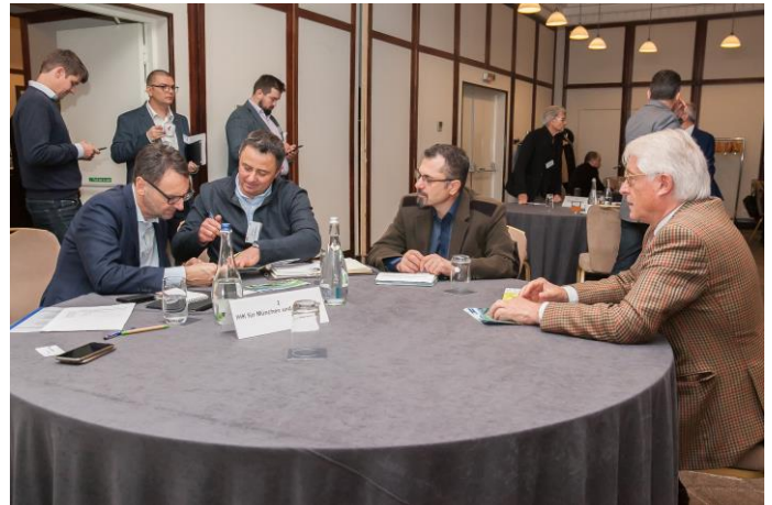
B2B-Gespräche von deutschen mit rumänischen Firmen in Bukarest

Die wirtschaftlichen Beziehungen zwischen Rumänien und Deutschland sind enger denn je und bieten weiterhin erhebliches Potenzial für die Entwicklung von Exporten und einzelnen Branchen. Rumänien behauptet sich zudem als attraktiver Standort für internationale Investitionen und technologische Entwicklung. Die gezielte Nutzung von EU-Fördermitteln hat maßgeblich zur Modernisierung industrieller Kapazitäten, zur Entwicklung von Industrie- und Technologieparks sowie zur Verbesserung der logistischen Infrastruktur beigetragen. Dadurch entstehen zunehmend stabile und verlässliche Rahmenbedingungen für internationale Beschaffungs- und Produktionsaktivitäten.