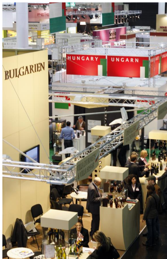
Снимка Дюселдорфски панаир