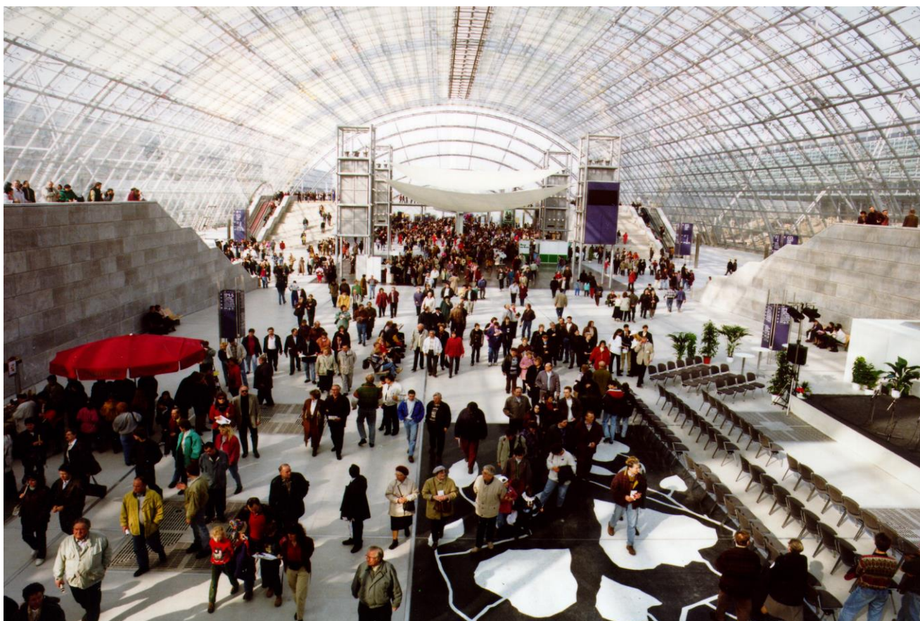
Снимка: Лайпцигски панаир